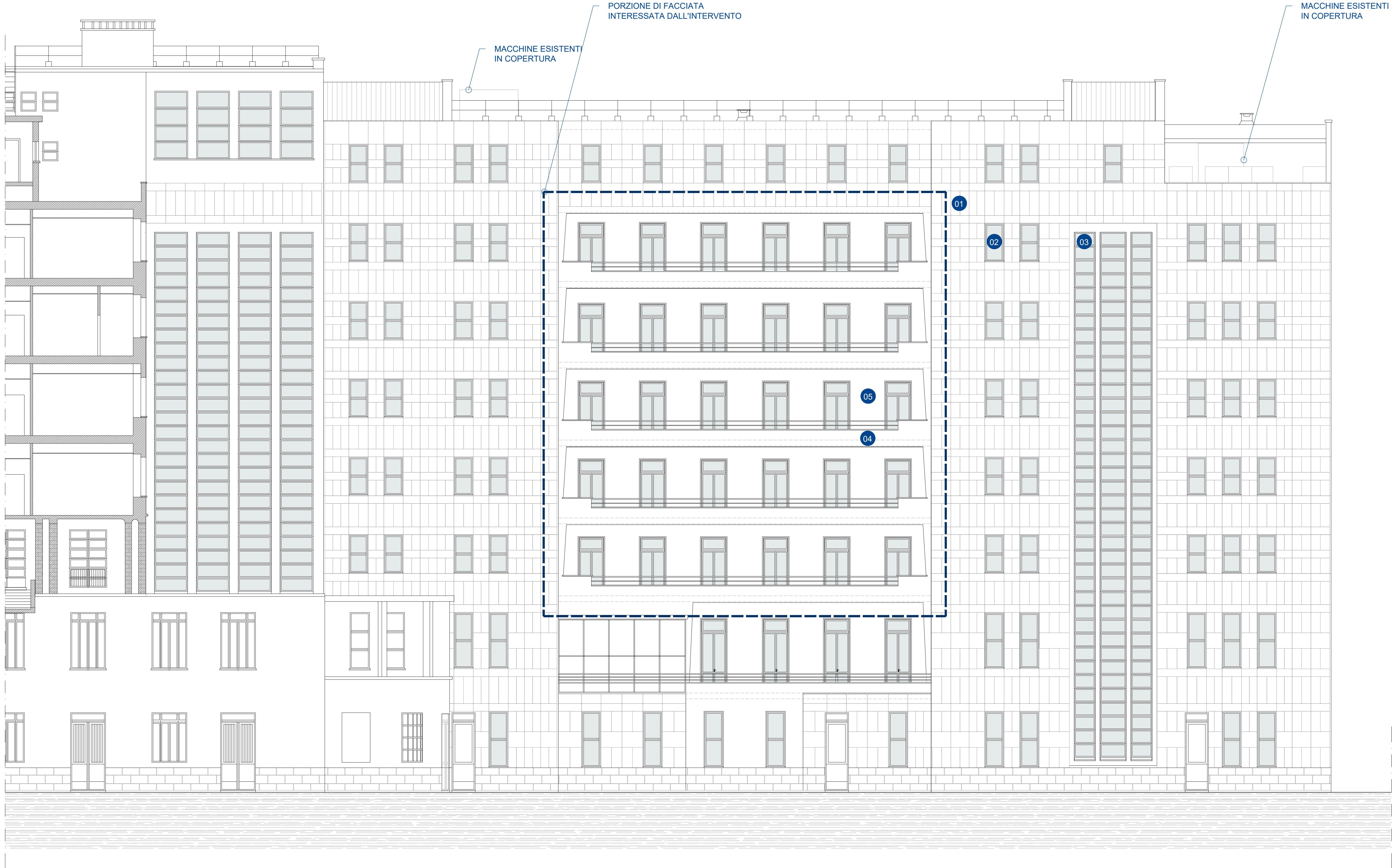
PROSPETTO POSTICO II