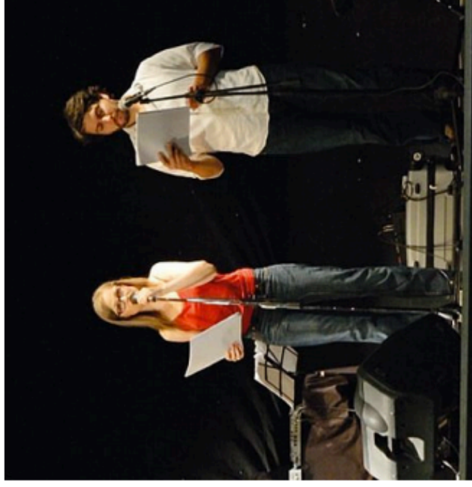
Un momento dello spettacolo dedicato al fondatore dell'Ictp

Già oggi, però, è in programma un altro evento a margine della mostra: alle 18 nella Sala Veruda di palazzo Costanzi, il giornalista e scrittore Pietro Spirito condurrà l'incontro pubblico "Tanto vale che sia un'avventura. La guerra di Paolo Budinich" organizzato dalla Sissa. Spirito si riallaccia alla drammatica vicenda del sommersibile Medusa - affondato al largo di Pola il 30 gennaio 1942 con 14 uomini intrappolati vivi all'interno - per raccontare l'esperienza bellica di Budinich, sommersibilista durante la Seconda guerra mondiale.