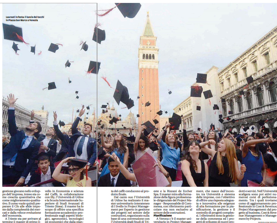
Laureati in festa: il lancio dei tocchi in Piazza San Marco a Venezia

vello in Economia e scienza del Caffè, in collaborazione con Ily, l'Università di Udine e la Scuola Internazionale Superiore di Studi Avanzati di Trieste (Sissa). Il master ha lo scopo di offrire una specifica formazione accademico-professionale sugli aspetti biologici, agronomici, tecnologici ed economici che dalla pianta